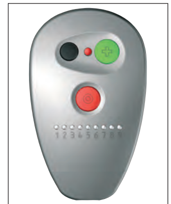
Steuerung mit Überlastungsalarm

4. Das Drehzahlregelungssystem begrenzt automatisch die Geschwindigkeit bei Überlastung. Sie arbeiten weiter. Eine tolle Sache!