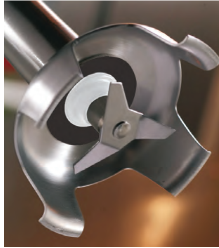
Spezielle Form des Klingenschutzes

1. Tolle Sache: Spezielle Messerform (spritzt weniger). Das Smart Drehzahlregelungssystem begrenzt die Geschwindigkeit, sobald das Werkzeug keinen Speisekontakt mehr hat.