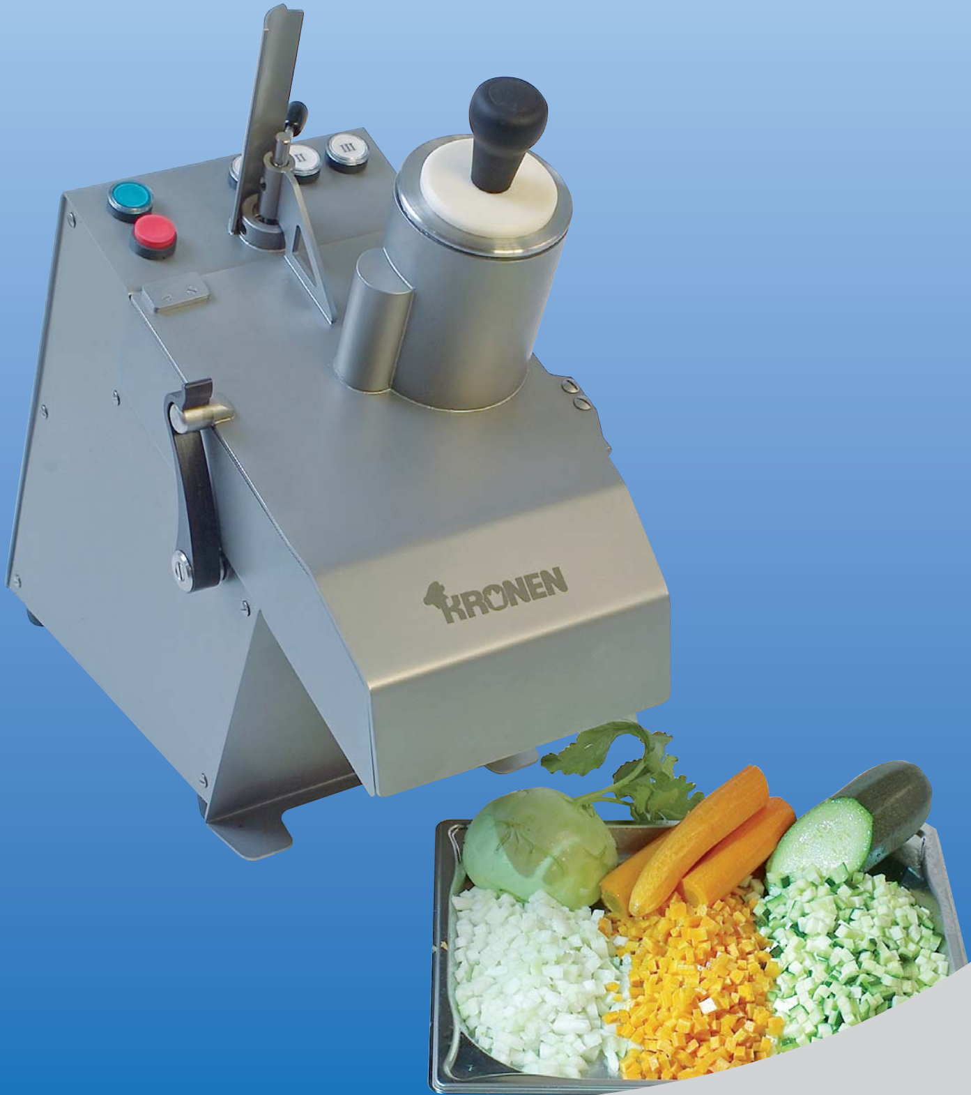
Kronen Gemüseschneider Serie KG Zubehör-Aufsatz zum Schneiden von Brunoise