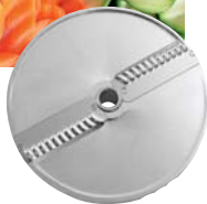
Wellenschnittscheibe 2, 3, 6 mm für Buntschnitt.