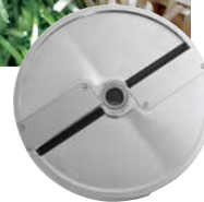
Streifen-/Juliennescheibe 2x2, 3x3, 4x4 mm für perfekt sauber geschnittene Karotten, Rote Beete, Sellerie, Zucchini etc.