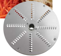
Raffelscheibe 2, 3, 4, 7, 9 mm für Karotten, Käse, Sellerie, Rösti etc.