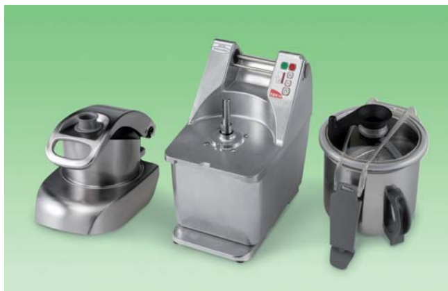
Kombinierter Tischcutter / Gemüseschneider