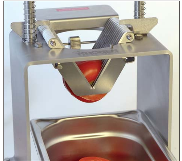
Scheibeneinsatz für Tomaten 5,5 mm